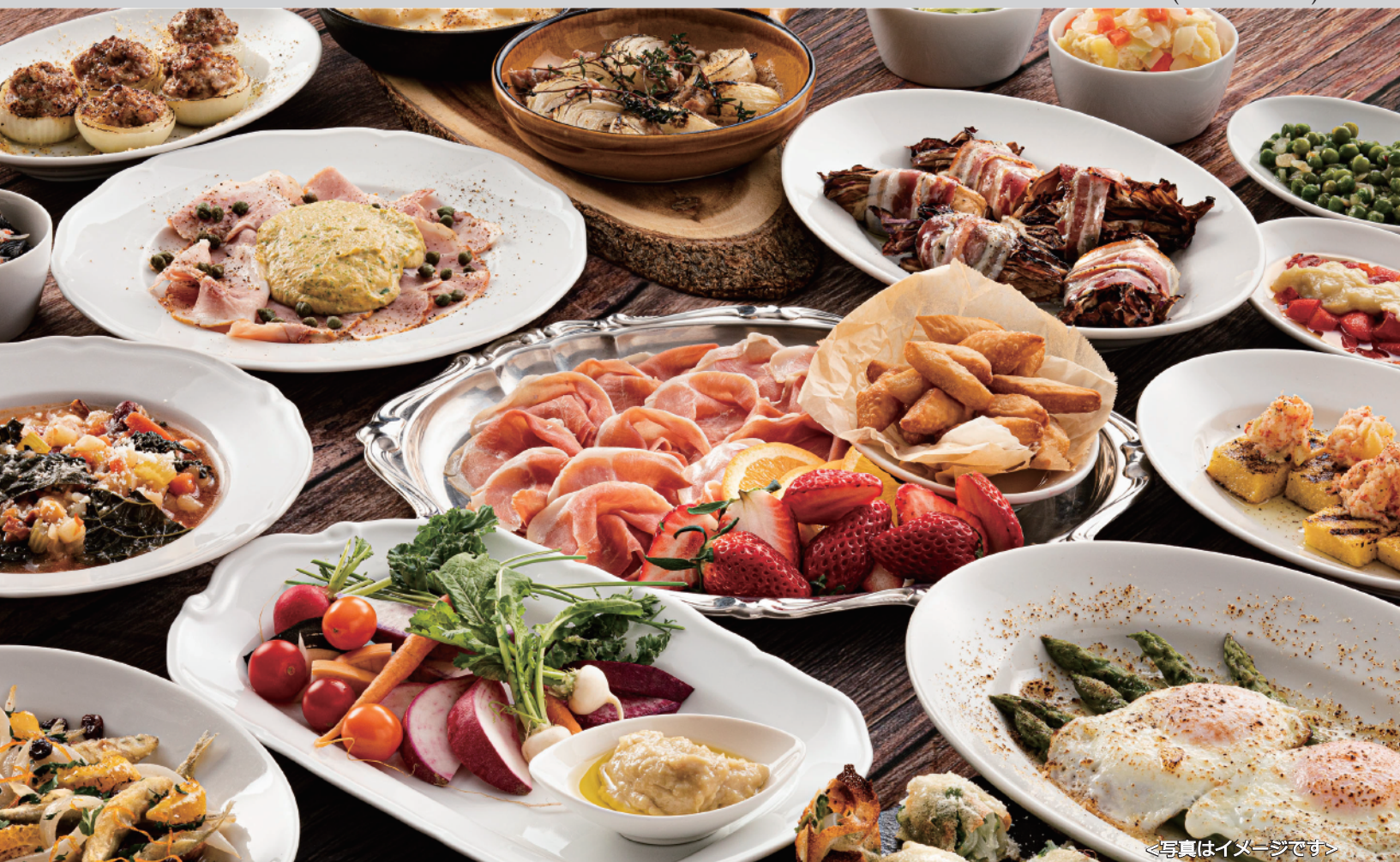
<写真はイメージです>

ジビエや煮込み料理を中心とした北イタリアの郷土料理やワイン・スプマンテもご用意しております。 約20種類以上の前菜をbuffet形式でお楽しみいただけます。 パスタ・ピッツァ・メインはお好きなお料理をお選びください。